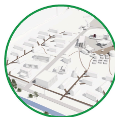
Kloten ZH ↗