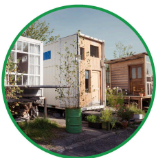
Altstätten SG ↗

Diese Wohn- und Lebensform hat in der Schweiz schon einige Projekte hervorgerufen. Diese unterstreichen die Wirkung der Bewegung und zeigen die Mehrwerte auf. Wir möchten auch im Raum Bern inspirieren und mit Mut sowie Pioniergeist ein solches Projekt umsetzen. Werden Sie ein Teil davon.