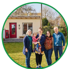
Aarau AG ↗