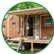
Saland ZH ↗